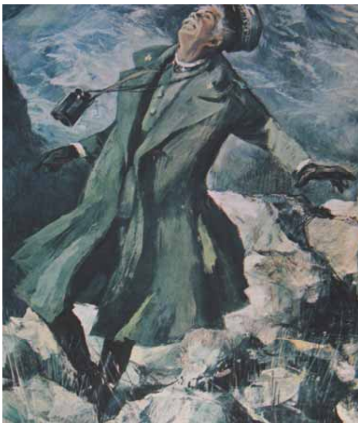
Il pittore Alfonso Artioli rievoca il momento della morte di Cantore sulle Tofane. Questa immagine fu anche pubblicata nello speciale “La Guerra che vincemmo” edito nel 1968 per i lettori di “Storia Illustrata”.

L'attualità di Cantore fu poi favorita dal luogo della morte: Cortina, meta indiscussa anche per i Vip che salivano sulle Dolomiti. Fra questi vi furono personaggi influenti come scrittori, storici e giornalisti che continuarono a scrivere sul Generale, rammentandone sempre la Figura circondata da quel alone di mistero (9) ... che, insieme al mito, lo hanno eternato.