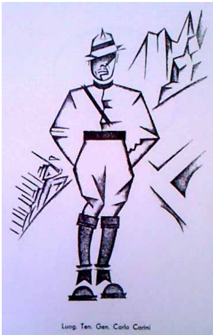
Curiosissima caricatura che raffigura Carlo Carini già Generale della Milizia fascista.

Come scritto all’inizio di questo contributo, un documento di Cantore è riemerso (3): si tratta di una lettera che scrisse nel 1913 e che poi venne conservata nell’archivio dell’Associazione Alpini, sezione di Milano: