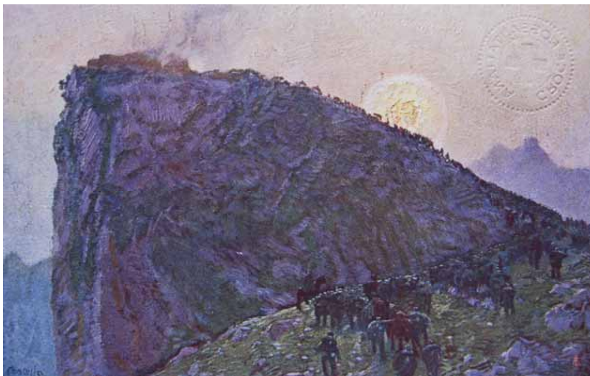
Cartolina edita dalla Croce Rossa a beneficio dei feriti; illustra l'avanzata italiana sui monti di Borghetto. Il forte che brucia è opera di fantasia, anche se, a ben guardare a sinistra mentre si entra sull'autostrada del Brennero, direzione Trento, al casello di Affi, si scorge un forte di epoca napoleonica. Il confine politico fra Regno d'Italia e Impero austro-ungarico, passava di lì.