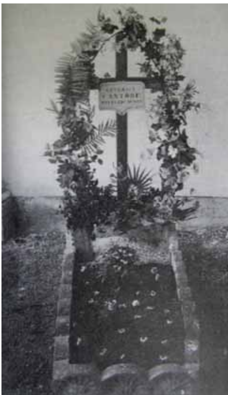
La prima semplice tomba del Generale posta all’interno del cimitero civile di Cortina