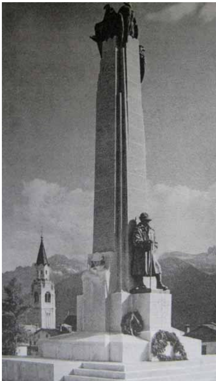
Il monumento a Cantore posto a Cortina d'Ampezzo nel 1921.

L'Autore di questa poesia? Nientemeno che E. A. MARIO! Sì, proprio quel E.A. Mario (Antonio Gaeta) autore della famosissima “Leggenda del Piave” ... questo fatto tuttavia non deve stupire, poiché Antonio Gaeta, impiegato alle poste, scrisse più di duemila canzonette, poesie, ritornelli, ecc. Cantore non sfuggì alla sua arte!