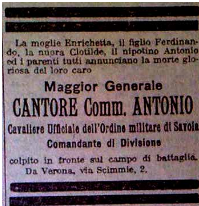
Il necrologio comparso sul Corriere della Sera tre giorni dopo l'avvenuta morte del Generale.

“Io, allora, già sergente per merito di guerra in Libia, mi trovavo a Zuel, all’hotel Silvano con il 38° Ospedale da Campo al seguito delle truppe alpine. Una telefonata mi fece partire subito con una squadra per portare giù il generale morto; ma arrivati subito sul posto con una camionetta, trovammo che alcuni alpini e alcuni fanti arrivavano al rifugio Dibona col cadavere sistemato in una barella e là era già per arrivare un camioncino che doveva portare il generale a Cortina.