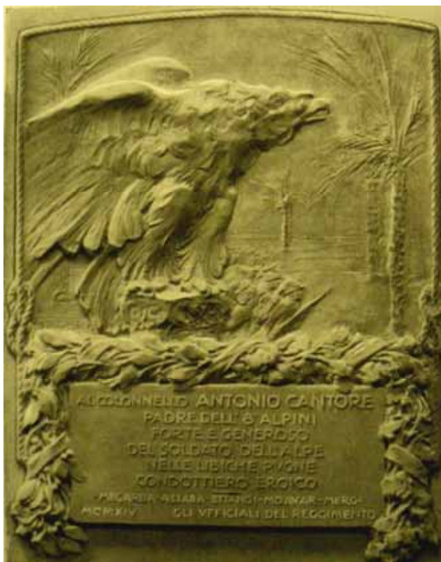
Targa in bronzo prodotta dallo Stabilimento Johnson in ricordo delle imprese libiche di Cantore, offerta dagli ufficiali dell’8° reggimento alpini .

Seppellito nel Cimitero Militare di Cortina, il 22 – 23 luglio XVII E.F. (1938) fu traslato nel nuovo Sacrario di Pocol.