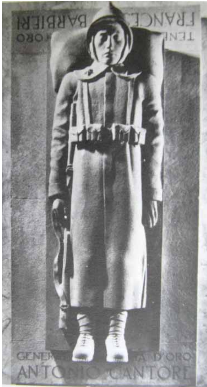
Sacello che contiene le spoglie di Cantore e dell'altra Medaglia d'Oro alpina, ten. Francesco Barbieri. Quest'ultimo è morto sulle Creste di Costabella (a 80 km da Cortina!), ma seppellito a Pocol perché — ufficialmente — altro Oro attribuito sulle Dolomiti fra gli Alpini ...

battaglia; la sua presenza bastava a fare, dei reparti ai suoi ordini, travolgenti valanghe di uomini; il suo disprezzo sdegnoso della morte, trascinava i trepidi e creava, attorno al generale, il mito della invulnerabilità.